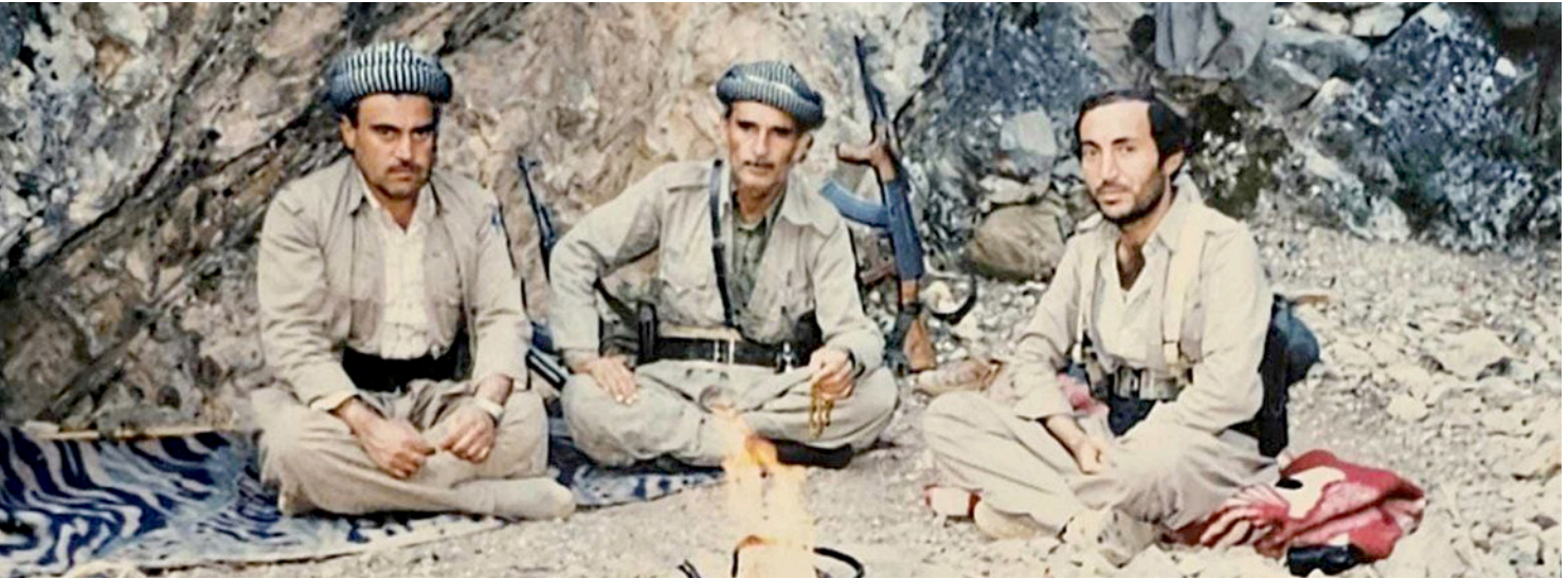
ئهدیب چه لکی- شههید عه مری له علی و حمید شریف چه من توی یا ده فهرا دۆسکی ژۆریا مه ها ۹ سالا ۱۹۸۸